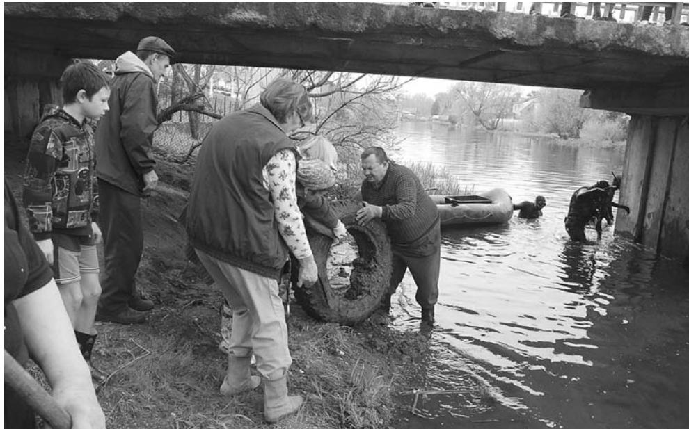
Iš Akmenos upės tarp gausybės šiukšlių buvo traukiamos padangos...

Narai jau tradiciškai prieš visuotinę švarinimosi akciją vėl nardė Akmenos upėje, iš kurios traukė žmonių atsikratytus daiktus, sumestas šiukšles. Šįkart jie drauge su savanoriais plūšėjo ties tilteliu prie buvusios žuvų parduotuvės.