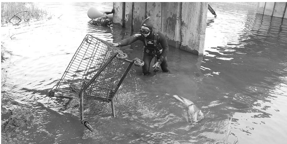
... ir prekybos centro vežimėliai.