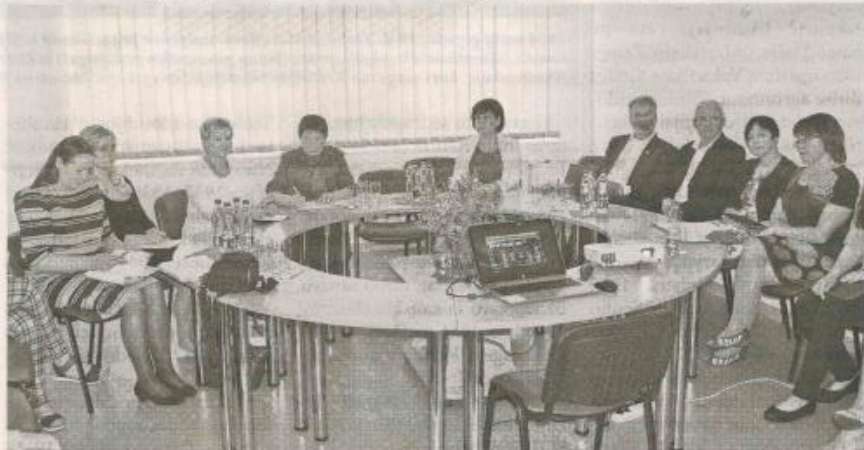
Švietimo komiteto nariai domėjosi Kretingos rajono švietimo centro veikla po reorganizacijos.