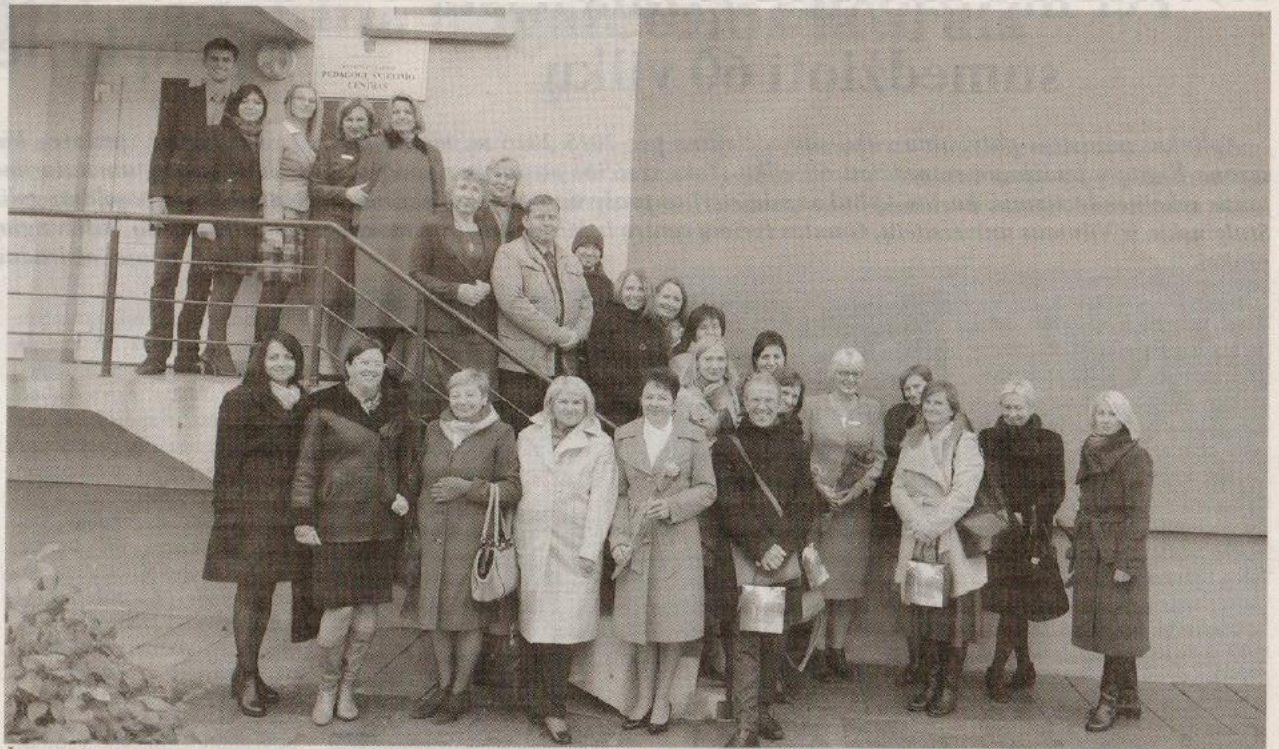
Sventinės popietės svečiai pakviesti apžiūrėti Kretingą, pamatyti, kokia ji graži, muziejaus Amatų centre jų laukė pramoga – edukacinis užsiėmimas „Kretingos dvaro saldaininė“.