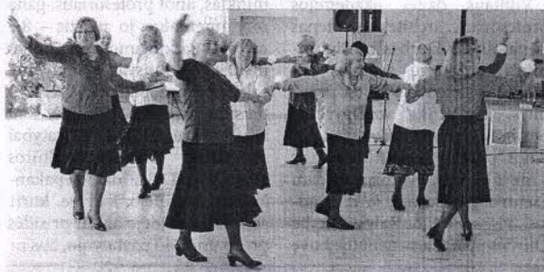
Visus sužavėjo senjorės šokėjos.