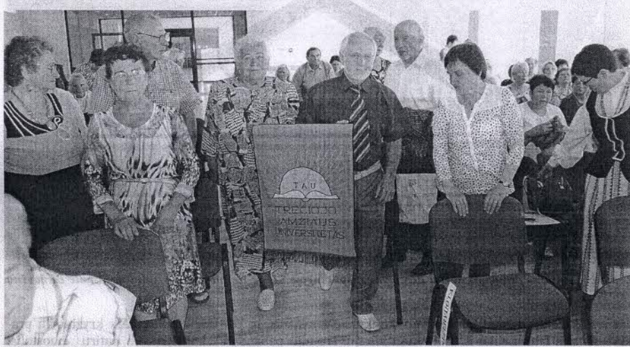
Šventė prasidėjo tradiciškai – įnešant TAU vėliavą, sugiedant universiteto himną.